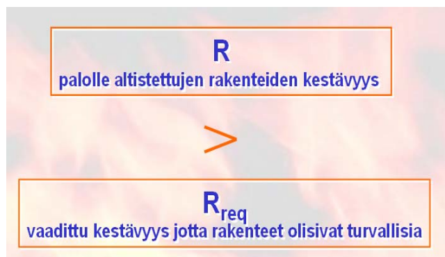
Kuva 1. Täytettävät vaatimukset, jotta saavutetaan turvallinen rakenne.

Rakenteiden paloturvallisuussuunnittelun päämääränä on saada luotettavat laskentamenetelmät turvallisten rakenteiden suunnittelemiseksi palotilannetta varten. Tämän päämäärän saavuttamiseksi on tarpeen demonstroida näiden menetelmien avulla, että rakenne säilyttää kantokykynsä ajan, joka on pitempi kuin aika, joka vaaditaan turvallisuudelle (ks. kuva 1)