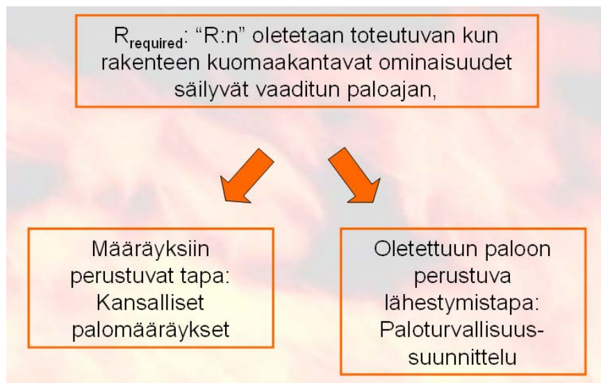
Kuva 3. Vaatimukset

Rakenteen turvallisuuden määrittämiseksi tarvitaan myös tietoa selvistä vaatimuksista, mitä rakenteen tulee täyttää. Normaalisti nämä vaatimukset määritetään ajan funktiona. Jokaisessa maassa on normeja ja määräyksiä näistä vaatimuksista (ohjeelliset vaatimukset). Paloturvallisuussuunnittelun kautta on kehitetty erilaisia menetelmiä näiden vaatimusten määrittämiseksi realistisemmalla tavalla (oletettuun paloon liittyvät vaatimukset, ks. kuva 3, vaatimukset).